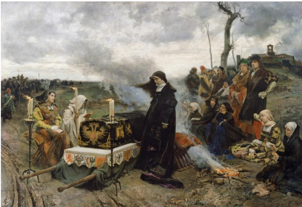
Francisco Pradilla. Doña Juana la Loca. 1877

En ambas clasificaciones, el duelo prolongado se refiere a la pérdida a causa de la muerte de un ser querido. El duelo prolongado se caracteriza por ser una respuesta normal pero persistente y profunda ante la pérdida de un ser querido. Las diferencias que establecen con el duelo "normal" son sólo por su duración y su intensidad.