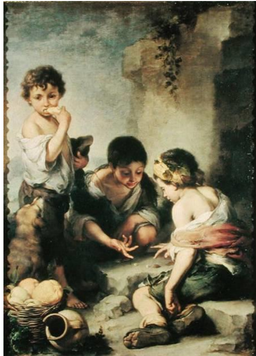
Niños jugando a dados. Bartolomé Murillo. 1670-75

Me sentí profundamente emocionada. No lo imaginaba, no, lo que le habíamos ayudado, pero, sí, habíamos dado mucho valor a sus sentimientos.