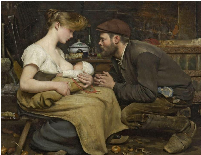
Jean-Eugène Buland. Felicidad de los padres. 1903

Ellos me dieron permiso para entrar en la intimidad de la familia y pude cuidar su duelo y su "depresión" ayudándoles a integrarla en su crecimiento como personas.