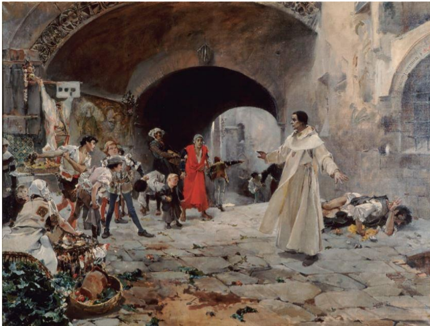
El Padre Jofré protegiendo a un loco. Joaquín Sorolla. 1887