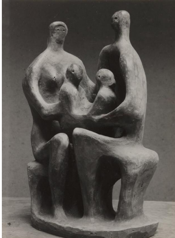
Grupo familiar. Henry Moore. 1944

este tipo de expresión del sufrimiento durante un período prolongado de tiempo, curiosa y frecuentemente, lo pueden manifestar en el momento en el que el hijo/a está mejor.