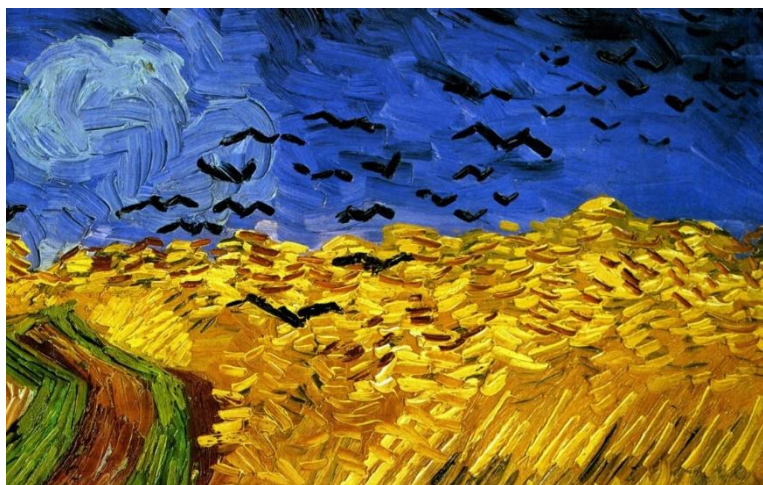
Campo de trigo con cuervos. 1890. Vincent Van Gogh