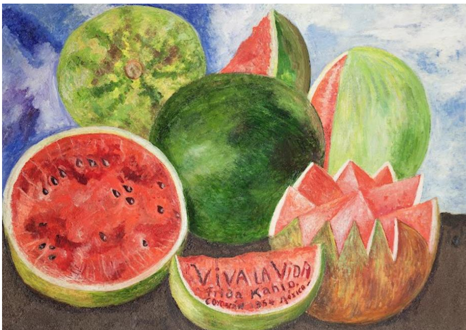
Viva la vida. Frida Kahlo. 1954

"Lo opuesto a lo vivo del infante es entonces un factor antivida derivado de la depresión de la madre. En tal caso, la tarea del infante es estar vivo, parecer vivo y comunicar que está vivo; en realidad esta es la meta última de tal individuo, al que se niega lo que tienen los infantes más afortunados: el disfrute de lo que pueden brindar la vida y el vivir." (Winnicott, 1963b, pág.251)